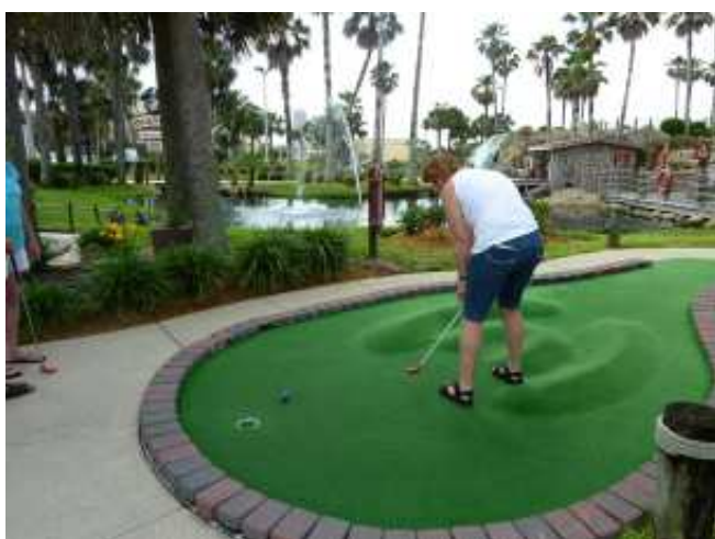
Stilstudie av en putt?