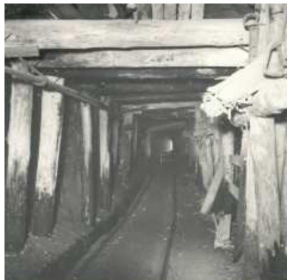
Förstärkning av bockort