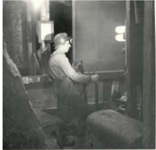
Spelstyrare under jord