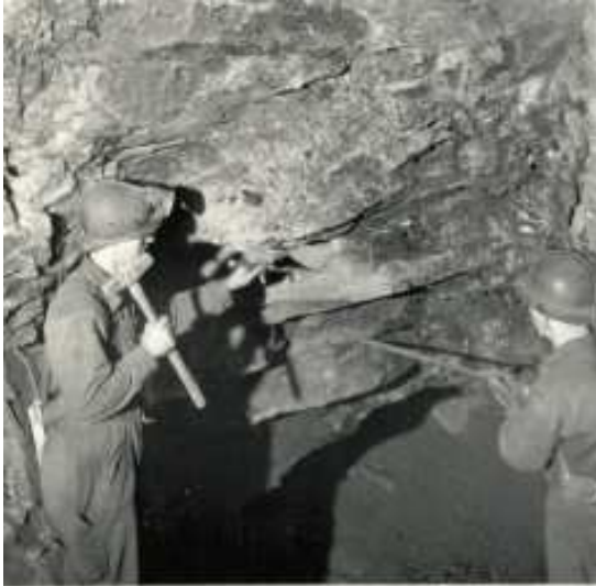
Skrotar = Lagar

och 1 – 10 ( en timmes rast ovan jord). Gruvan moderniserades på 60-talet. Vi gjorde rastkojor under jord. Det var som en liten matsal och då hade vi bara en halvtimmes rast.