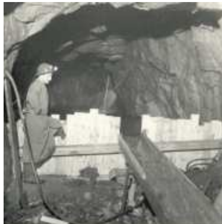
Tage Andersson står och tittar på ett bygge under jord – ett dammbygge på 500 m-nivån