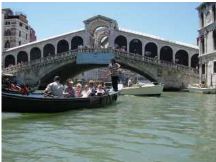
Ponte di Rialto