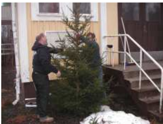
Denna sida opp !