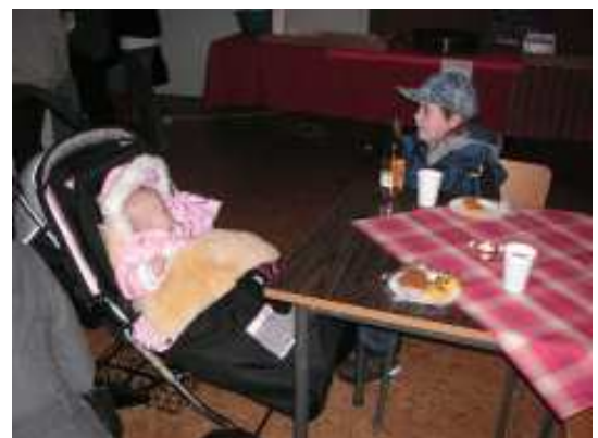
Får jag smaka eller ska du ha den för dig själv "Snåljap" ?!?