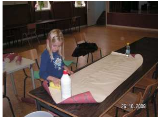
Stora som små hjälps åt med det man är bra på.