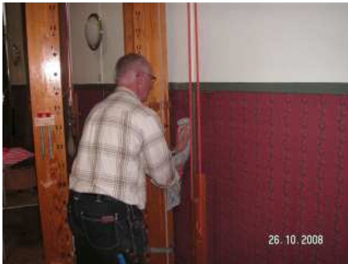
Sista våden i samlingsalen.