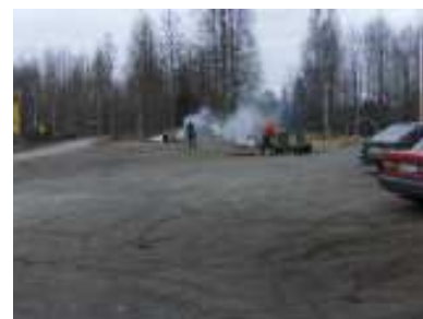
Marita sprang med både kamera och kratta